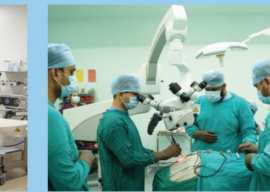
मॉड्यूलर ऑपरेशन थियेटर