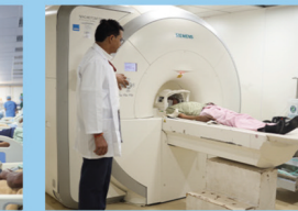
1.5 टेस्ला एम.आर.आई.