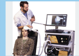
राजस्थान की प्रथम TMS थेरेपी